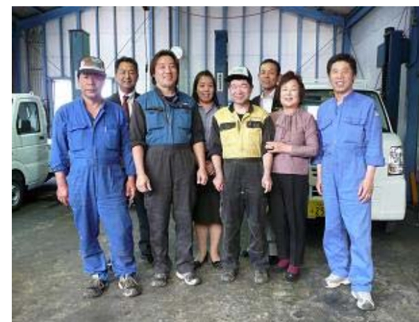
本町自動車整備工場様