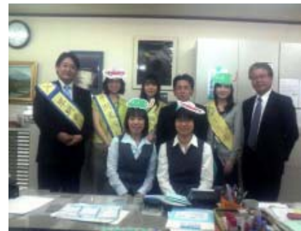
安田保険サービス様