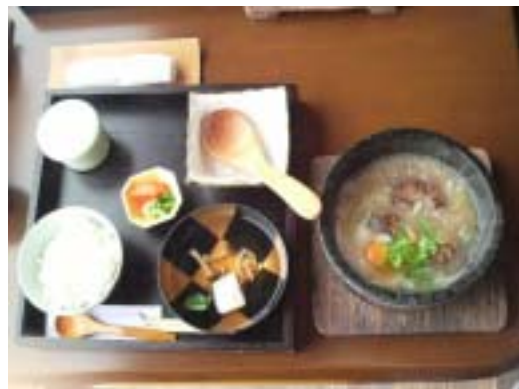
ゴマプリンと コーヒー付 ハンバーグ定食 980円