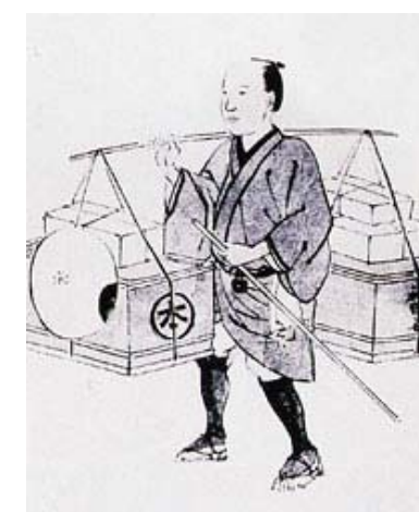
近江(滋賀県)の行商人