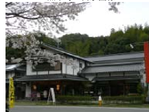
広川町：茶の葉堂様