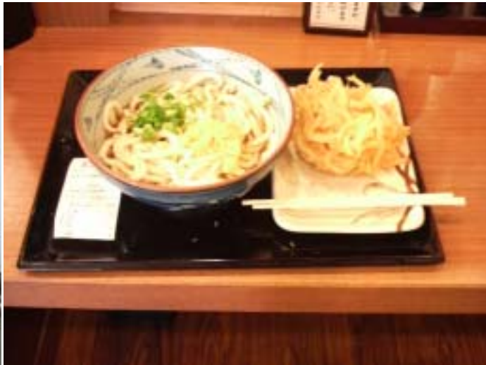
大盛りぶっ掛けうどんと小海老のかきあげ 2点で、合計510円