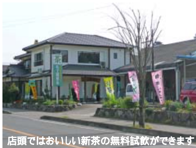
店頭ではおいしい新茶の無料試飲ができます