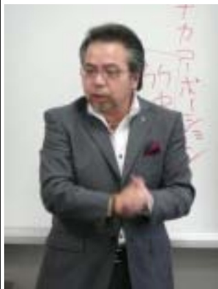
短時間でポイントをついたコンサル、さすが…