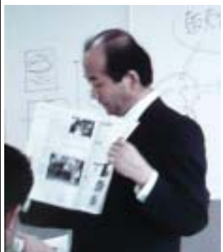
チラシなどの実物紹介