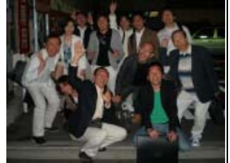
懇親会参加者は熱気ムンムン!!