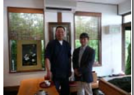
原野社長とご一緒