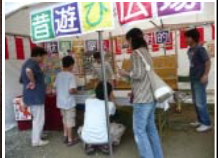
子供たちに大人気！！